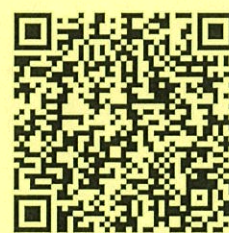
線上報名 QR code

※如需報名表電子檔歡迎電洽協會 02-55690858 或 E-MAIL 祕書處索取，謝謝。