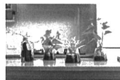
-天然日用及循環良品-