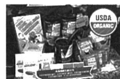
有機同等性 國家農產品展示